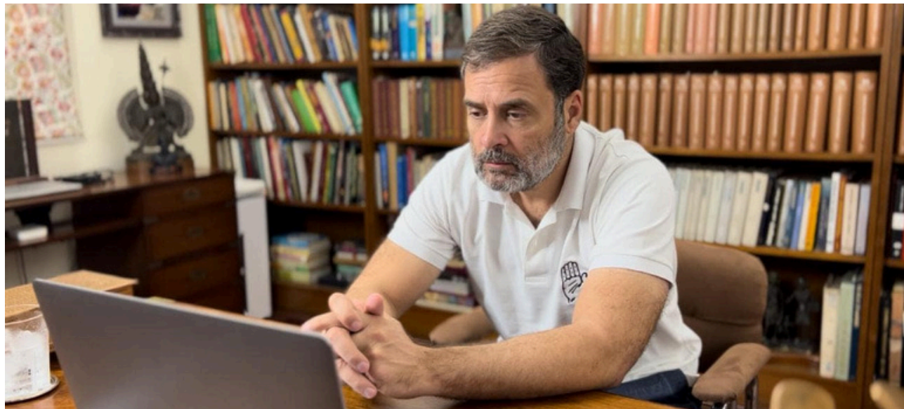
মহাৰাষ্ট্ৰৰ কৃষকৰ সৈতে বিৰোধী নেতা ৰাছল গান্ধীৰ অনলাইন বাৰ্তালাপ